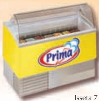
Isseta 7 luxus