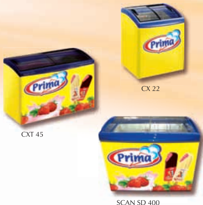
SCAN SD 400