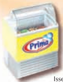
Isseta 4 luxus

Isseta 7 luxus a Samoa – oblá nástavba mrazícího boxu