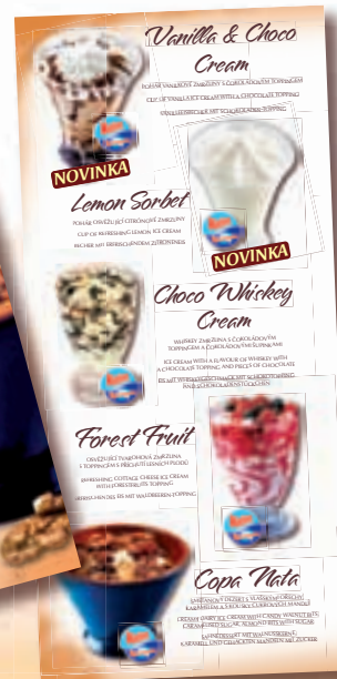
ICE CREAM DESSERTS